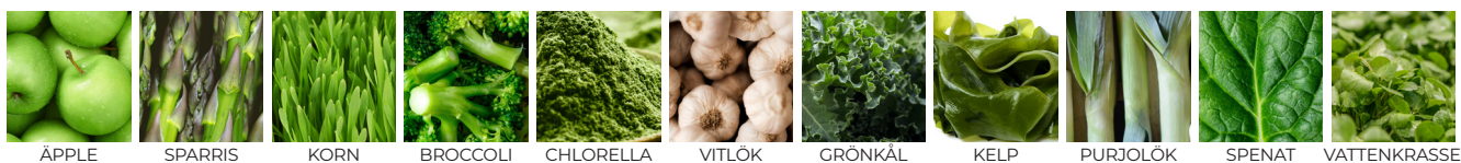
ÄPPLE SPARRIS KORN BROCCOLI CHLORELLA VITLÖK GRÖNKÅL KELP PURJOLÖK SPENAT VATTENKRASSE